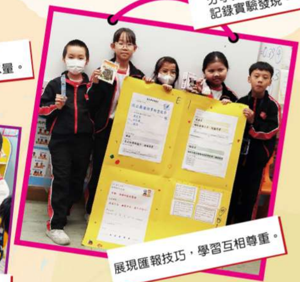
展現匯報技巧，學習互相尊重。