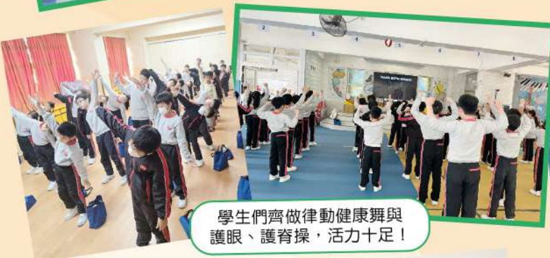
學生們齊做律動健康舞與護眼、護脊操，活力十足！