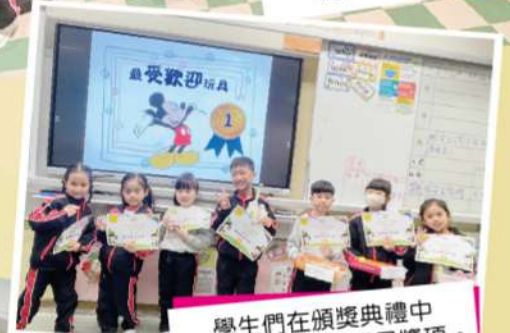
學生們在頒獎典禮中 獲得最受歡迎的玩具獎項。