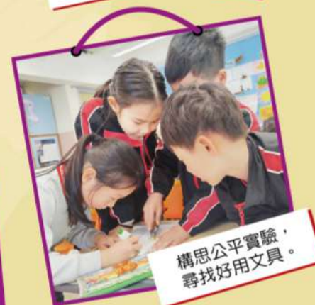
構思公平實驗， 尋找好用文具。