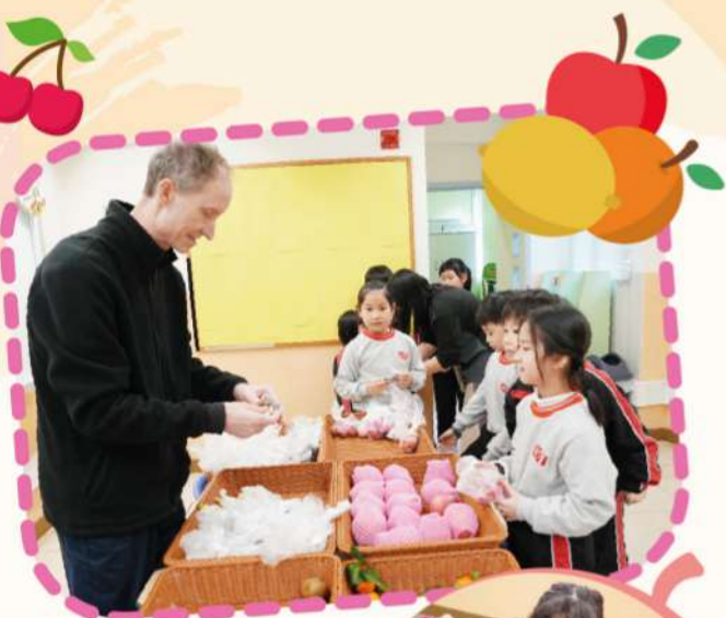
學生以水果券換取水果，亦練習英語對話能力。

活動中，學生們得以認識不同水果的營養價值，並發揮創意以水果入饌，一同製作美味菜餚，如水果三明治、水果沙拉、橙汁特飲及水蜜桃炒雞柳。另外，透過有趣的水果實驗，例如觀察蘋果切開後變色程度的「抗氧化」和「檸檬小火山」實驗，學生們得以了解相關的科學原理，後再化身「營養師」及「廚師」，運用所學設計色彩繽紛的營養水果餐單。最後，學生們分組整理自己的學習成果進行匯報，自信地展現學習成果。