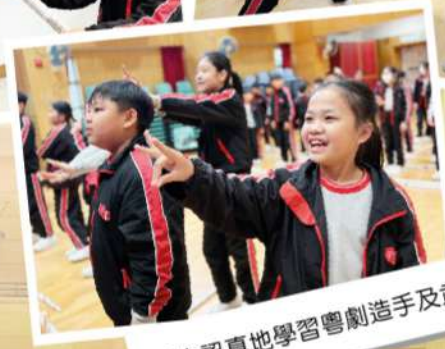
學生認真地學習粵劇造手及武打。