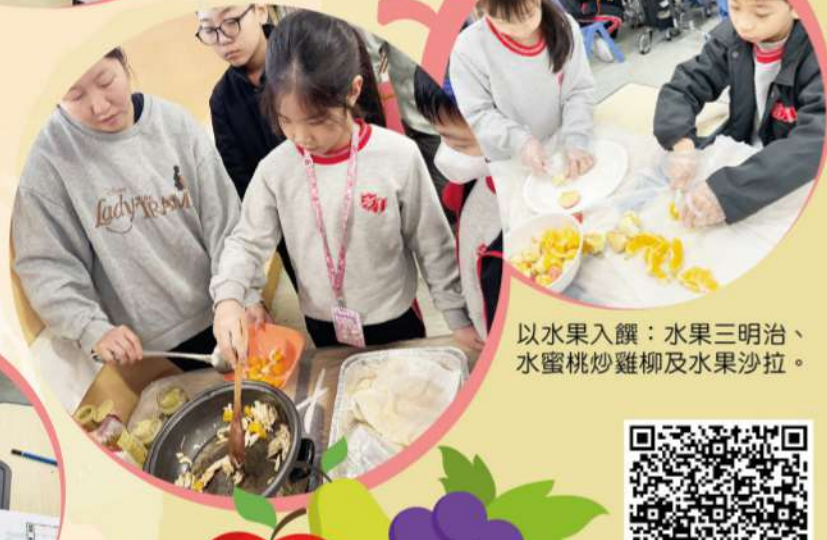
以水果入饌：水果三明治、水蜜桃炒雞柳及水果沙拉。