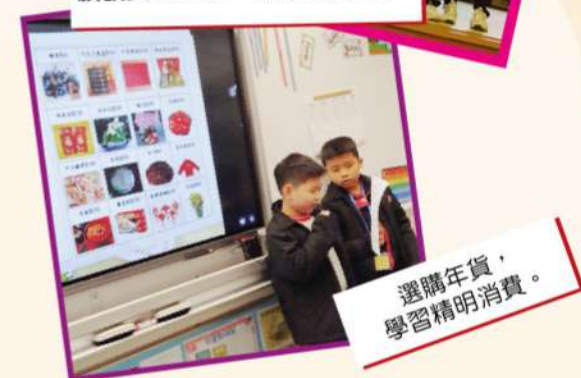
選購年貨， 學習精明消費。