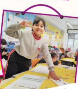
分享探究成果， 記錄實驗發現。