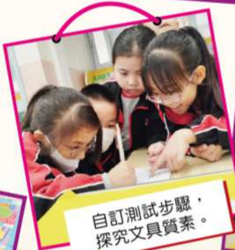
自訂測試步驟， 探究文具質素。