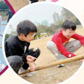
學生們在歷奇挑戰中各司其職，展現絕佳的團隊默契與解難能力。