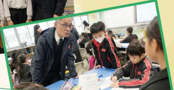
校監親臨現場，不僅加入討論，更於典禮上親自為表現優異的學生頒發獎項，給予學生莫大的鼓勵！