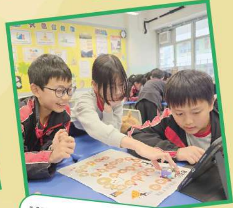
試玩自製的健康生活康樂棋。