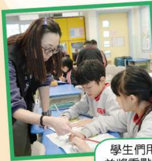
學生們用心整理已知的知識，並將重點逐一記錄在學習冊中。