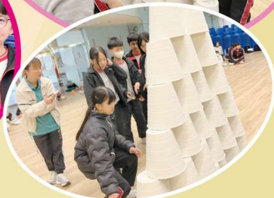
歷奇挑戰中，學生們分工合作，發揮團隊精神！