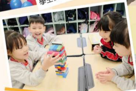
試玩智力遊戲——學生們小心 翼翼地穩住眼前的高塔。