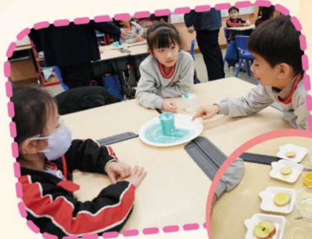
各項水果小實驗，學生可從中學習科學知識。