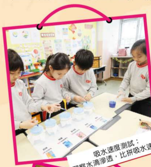
吸水速度測試： 觀察水滴滲透，比拼吸水速度。