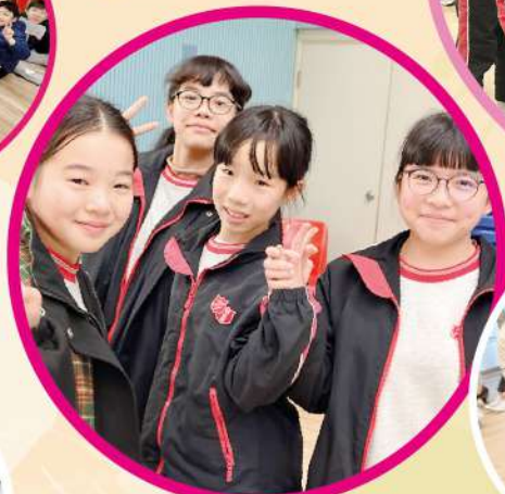
留下最燦爛的笑容！