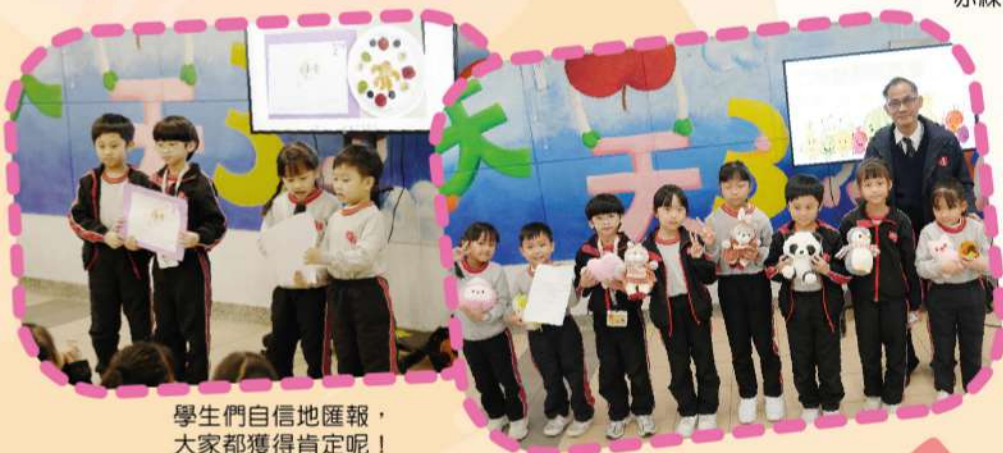
學生們自信地匯報，大家都獲得肯定呢！