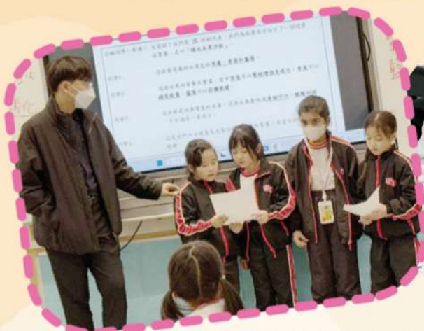
大家分工合作，準備展示自己的學習成果。