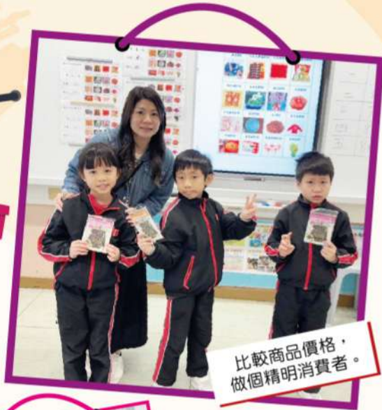
比較商品價格， 做個精明消費者。

透過「做中學」的寶貴體驗，學生們學會了在購物前多加思考，不再被華麗的包裝蒙蔽。這項活動不僅提升了他們的解難與數據分析的能力，更成功將科學探究融入日常生活，為學生從小建立批判性思維，養成理性分析、精明消費的好習慣！