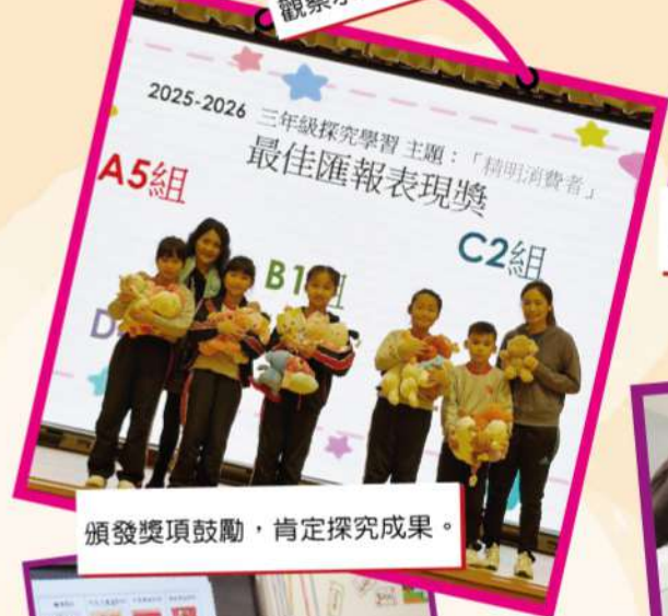
頒發獎項鼓勵，肯定探究成果。