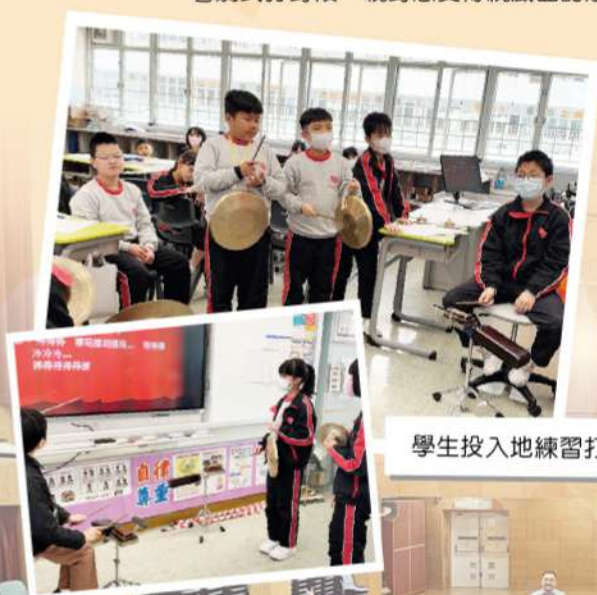
學生投入地練習打鑼鼓。