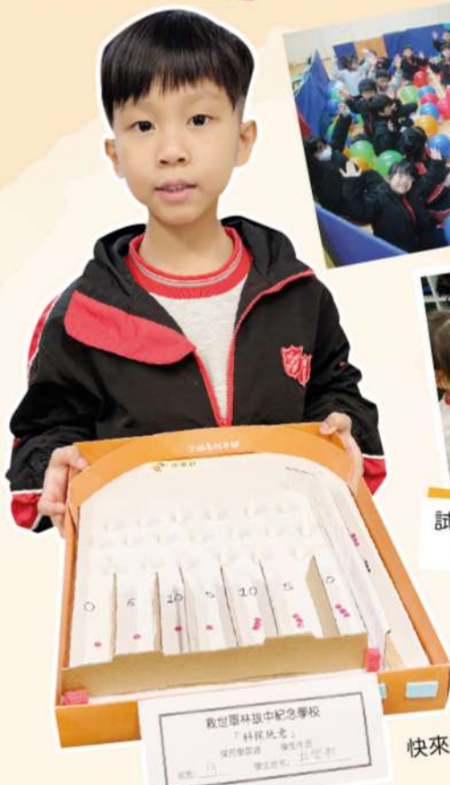
數世羅林道中紀念學校 「科學探究」 探究學習活動 日期：2026年2月9日至12日