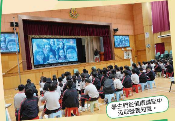
學生們從健康講座中汲取營養知識。