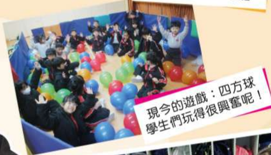
現今的遊戲：四方球 學生們玩得很興奮呢！