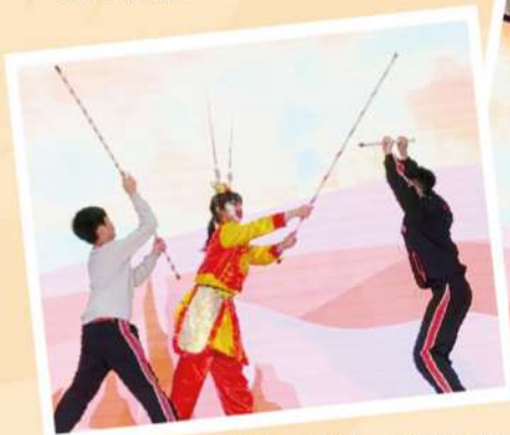
台上一分鐘，台下十年功！學生們認真練習粵劇武打身段，親身感受傳統戲曲的魅力。