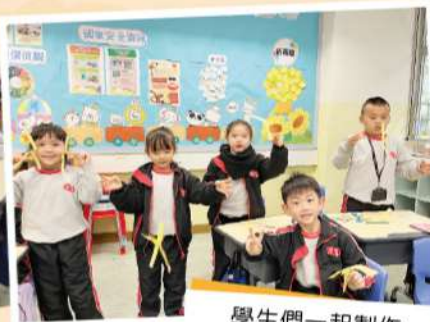
學生們一起製作 傳統玩具——紙蜻蜓。