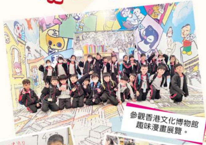
參觀香港文化博物館 趣味漫畫展覽。

這趟豐富的旅程讓學生深深體會「簡單就是快樂」，只要帶着好奇心與探究精神，生活處處充滿歡欣與啟發！