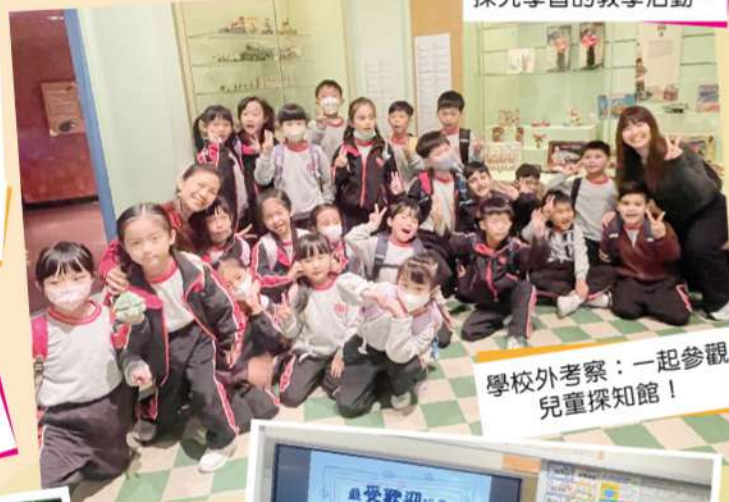
學校外考察：一起參觀 兒童探知館！