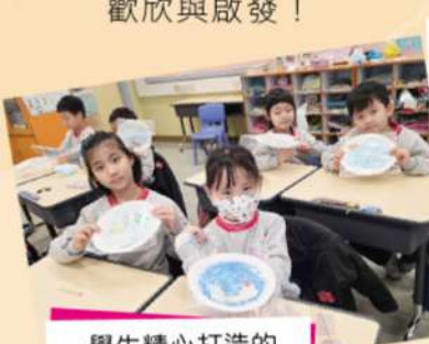
學生精心打造的 磁力水族館。