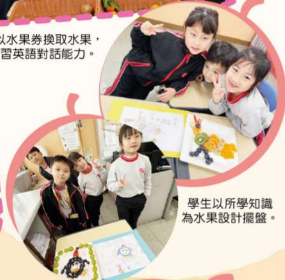
學生以所學知識為水果設計擺盤。