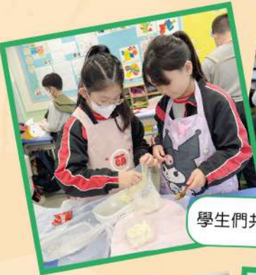
學生們共同自製健康雪糕。