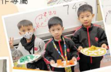
學生設計——滾動迷宮。