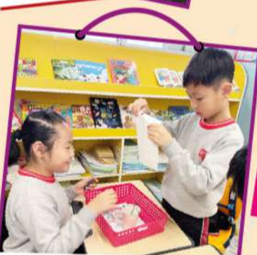
堅韌度測試： 放上重物測試，比較堅韌程度。