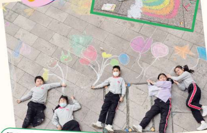
學生一起在操場上畫粉筆畫，嘗試以藝術形式放鬆心情。