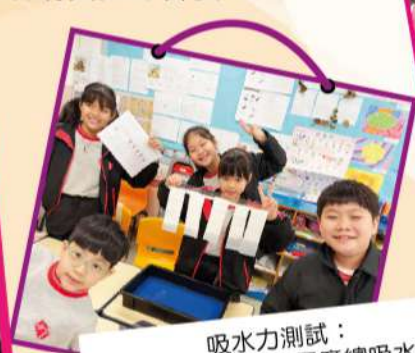
吸水力測試： 將產品浸入水中，量度總吸水量。