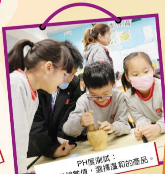
PH度測試： 測試酸鹼數值，選擇溫和的產品。