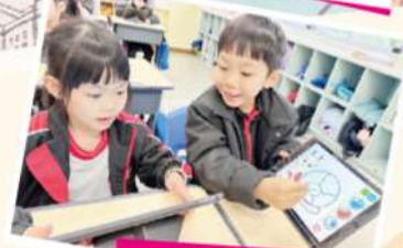
將平板電腦遊戲應用於 探究學習的教學活動。