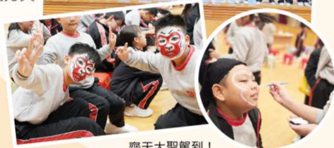
齊天大聖駕到！ 同學畫上精緻的粵劇妝容， 化身威風凜凜的孫悟空，維妙維肖！