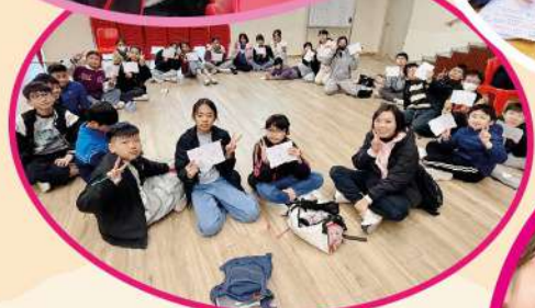
溫馨的分享時刻：學生們圍坐一圈互訴心聲，細數六年同窗的點滴與感動。